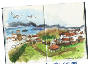
By Eduardo Salavisa in Caminha, Portugal

Mensen kiezen vaak voor het bekende. Zelfs op vakantie. Toeristische attracties. Een bepaald rondje. De grote wegen.